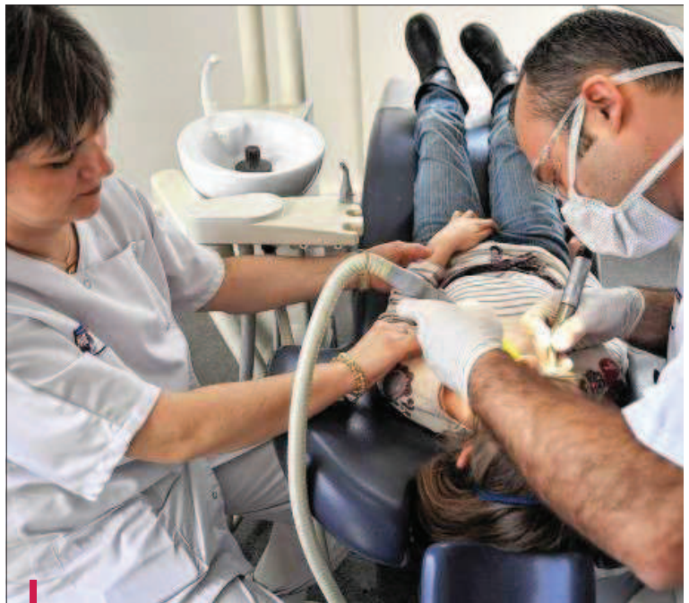
La RESC, résonance par stimulation cutanée, agit sur les réseaux énergétiques. Cette technique est expérimentée sur des petits patients du pôle odontologie.