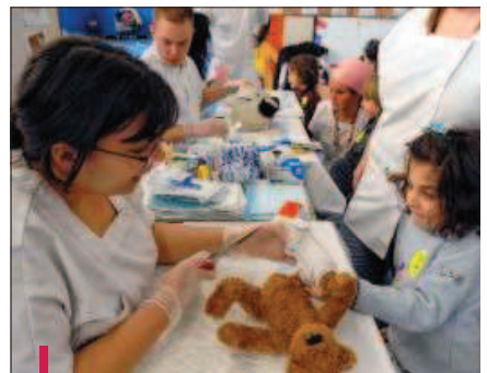
Le concept d'"hôpital des Nounours" est mis en œuvre à la Timone-Enfants pour faciliter les examens lourds.

Les étudiants de 3 e année de l'Institut de formations des manipulateurs radio ont développé le projet "IRM peluche et doudou-thérapie" pour diminuer le stress des petits patients. En amont de l'examen, une BD, "Bébé lapin et l'IRM" est proposée aux parents, pour faciliter la discussion avec l'enfant. Le jour de l'IRM, l'étudiant réalise une démonstration sur une maquette d'appareil d'imagerie adaptée à la taille d'une peluche, et in-